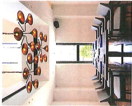
天井高6mの完全個室：着席 最大10名様