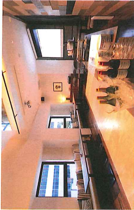
プロジェクトカウンター売場の半個室ダイニング：着席最大36名様 / 立食最大40名様