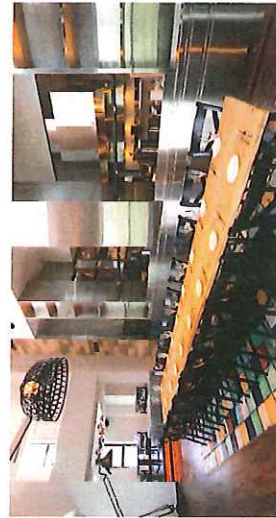
オープンキッチンを望む中国体席：着席 最大24名様