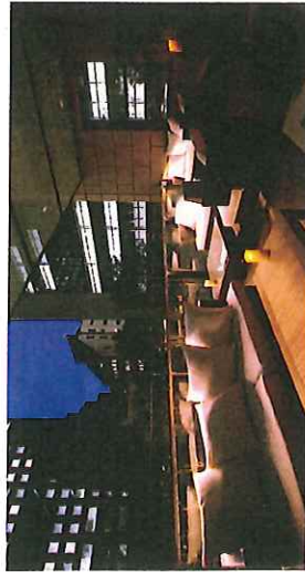
テラスはローソファタイプの贅沢空間：着席 最大10名様